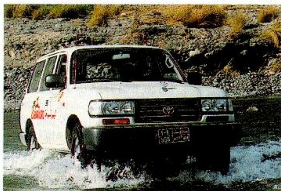
Wasserdurchfahrten in bizarrer Natur: Geländefahrten sind in Oman ein besonders exotisches Erlebnis.

Weil die Möglichkeiten, mit einem Geländewagen off-road zu fahren, in der Schweiz stark eingeschränkt sind, finden alle Erlebnistouren im Ausland statt. Für jene, die sich mit dem eigenen 4x4 in die